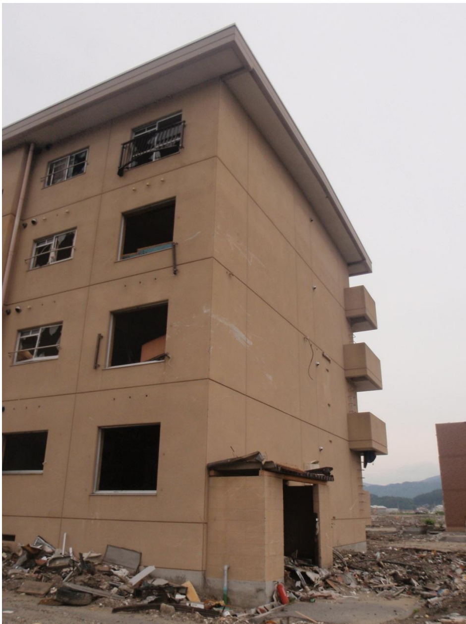
四階天井付近に見える浸水の跡