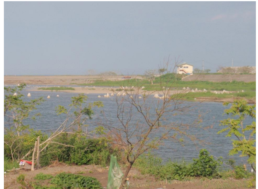
流されたテトラポット