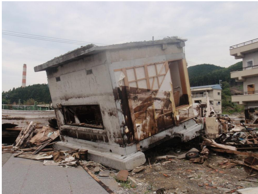
逆さになっているRC造