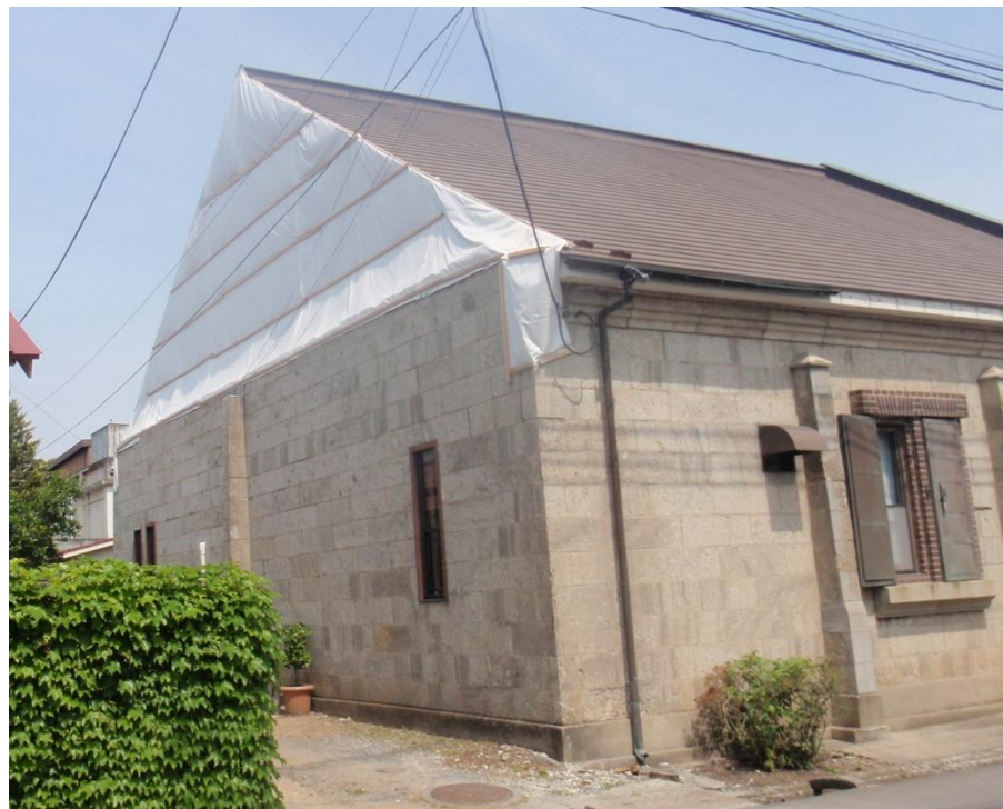
覆われたままの蔵