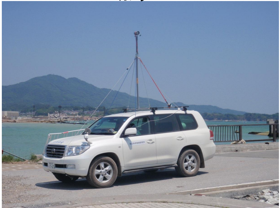
車の上に取り付けられたカメラ