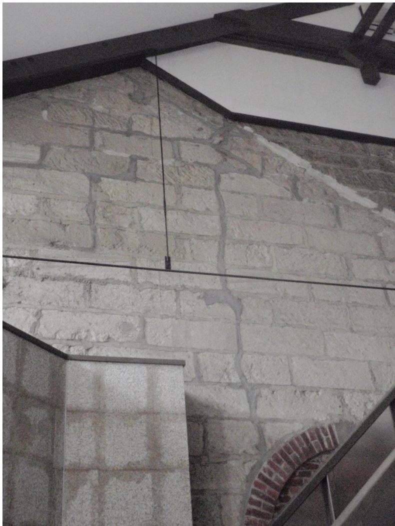
応急措置の施された壁