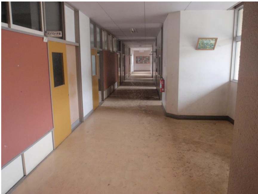
大船渡市立赤崎小学校 3階