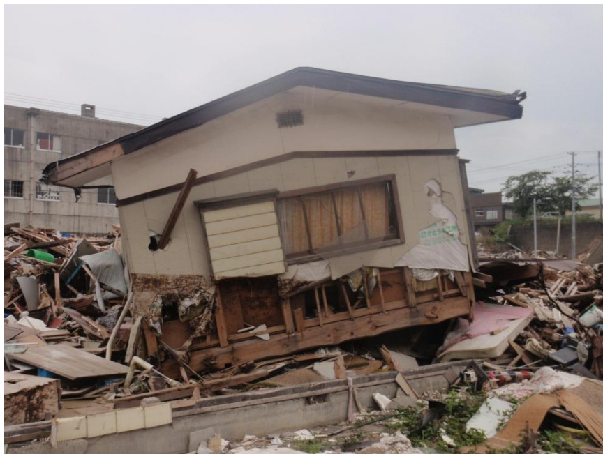
一階が潰れた木造