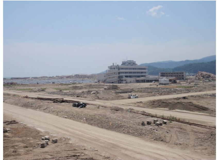
瓦礫が取り除かれたまち