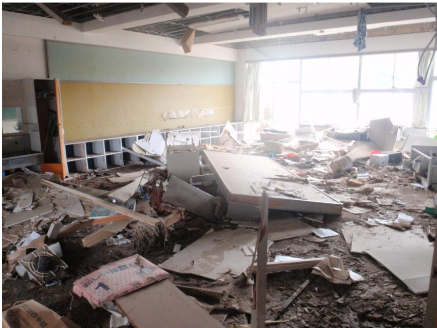
大船渡市立赤崎小学校 1階