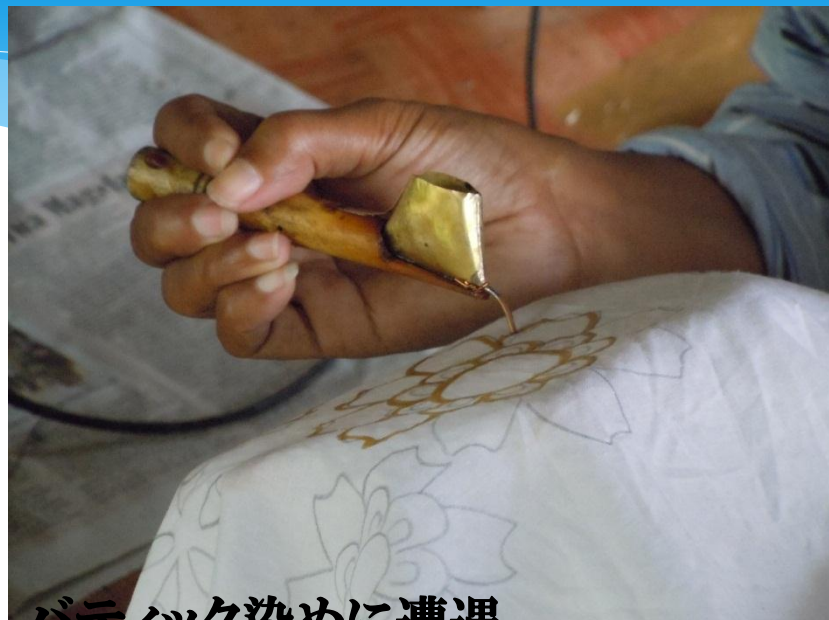
バティック染めに遭遇