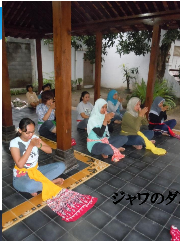
ジャワのダンスを習ってみました