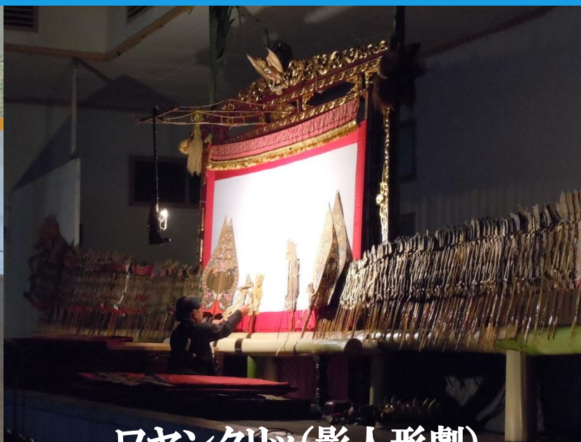
ワヤンクリッ(影人形劇)