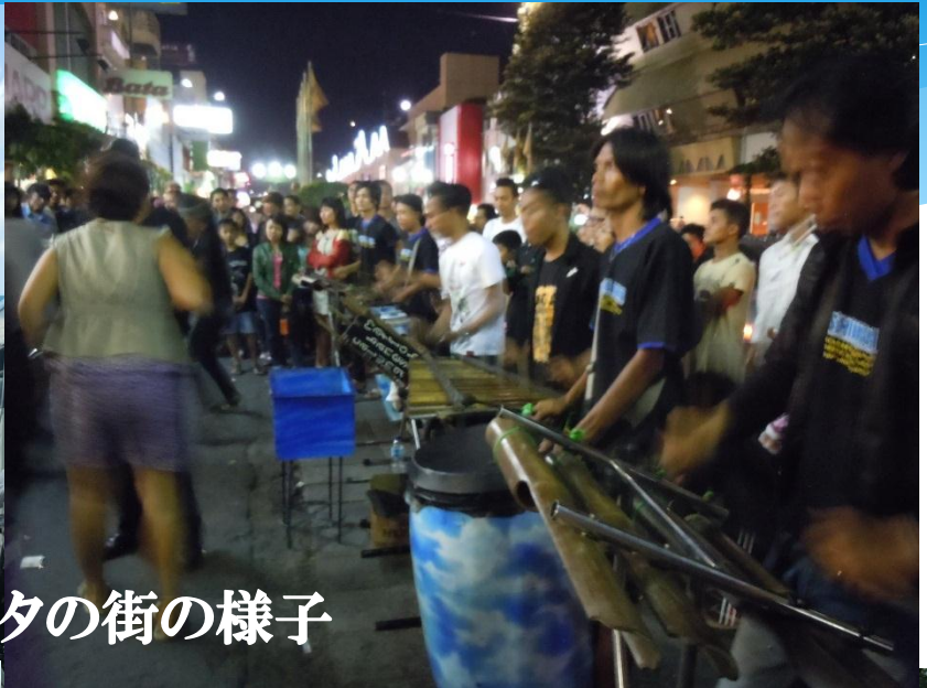
ジョグジャカルタの街の様子